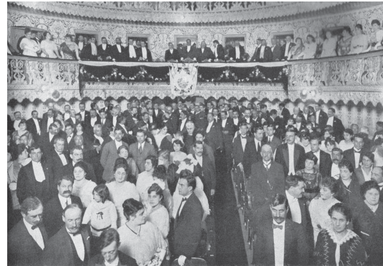
Representación de la ópera “Mañón” en el Teatro Progreso, (hoy Florencio Sánchez), con la presencia del Presidente de la República Oriental del Uruguay Dr. Feliciano Viera, el 9 de setiembre de 1915.